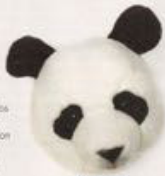
Wild&Soft. Tirolo con forma de oso panda (39 € en smallable.com).