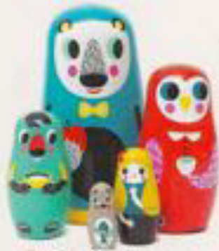
Dumnon. Conjunto de cinco muñecas de madera pintadas a mano (19,95 €).

A la hora de crear un entorno mágico, los detalles lo son todo. Te damos las mejores ideas para hacer de su habitación un lugar realmente especial donde descansar y jugar.