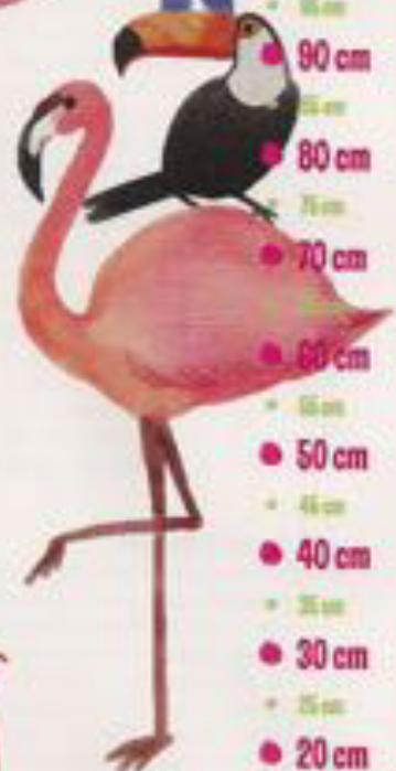
Tenvinilo. Sillón medidor (25 €).