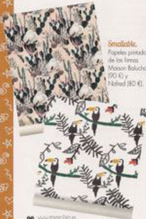
Smallable. Papeles pintados de las firmas Maison Baluchon (90 €) y Nafied (80 €).