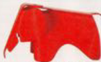
Vivá. Taburete Tames (86 € en smallable.com).