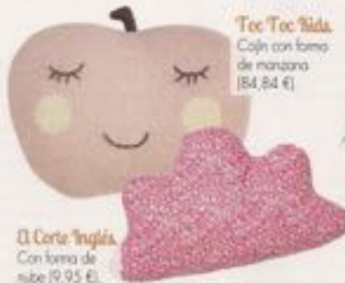
Tee Tee Vida. Cojín con forma de manzana (54,84 €).