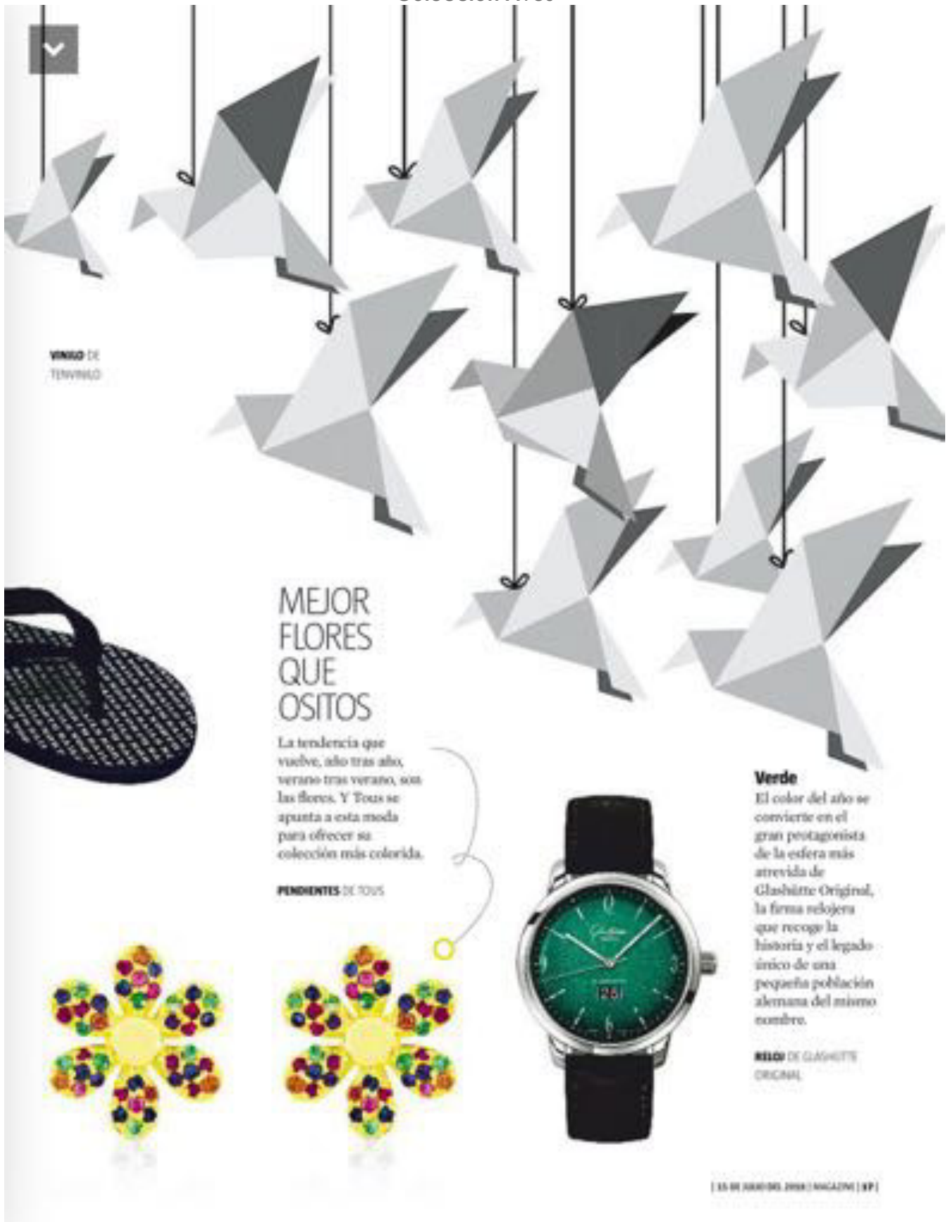
VINILO DE TENVINILO